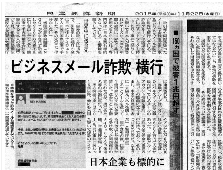
図： ビジネスメール詐欺の記事(日本経済新聞、平成30年11月22日朝刊)

実は、昨年の12月に同様の手口で、日本航空(JAL)が 3億6000万円 という巨額の被害にあいました。下は詐欺の手口です。